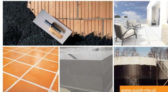
Būvju hidroizolācija Izolācija zem flīzēm